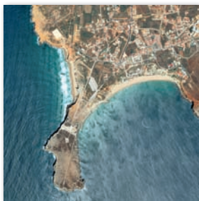
Ponta de Sagres