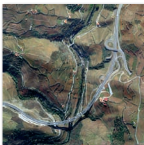
Peso da Régua